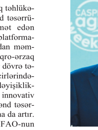
Beynəlxalq Qida Sənayesi Sörgisinin ("InterFood Azerbaijan") açılış mərasimində çıxışı zamanı sөsləndirib.