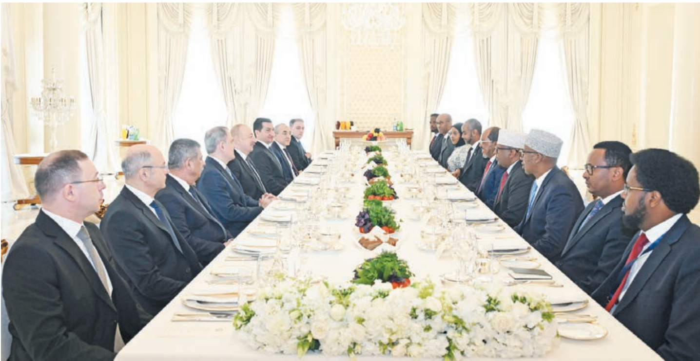
Fevralın 12-də Azərbaycan Respublikasının Prezidenti İlham Əliyevin Somali Federativ Respublikasının Prezidenti Hasan Şeyx Mahmud ilə lanç əsnasında geniş tərkibdə görüşü olub.

Prezident İlham Əliyevin Somali Prezidenti ilə lanç əsnasında geniş tərkibdə görüşü olub