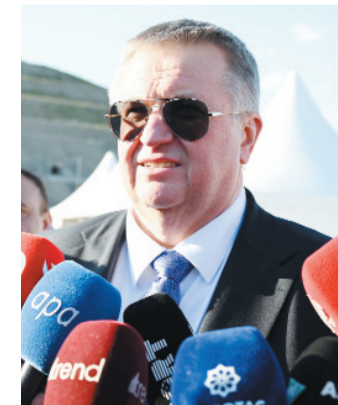
"Bu layihə bütün ölkələrimiz üçün birgə fayda yaradacaq", - deyərək fikrini tamamlayıb.

Overçuk əlavə edib ki, yaradılan müasir logistika infrastrukturunu gələcəkdə Rusiya, İran, Azərbaycan, Naxçıvan və Türkiyə istiqamətlərində yükdaşımaqların daha səmərəli həyata keçirilməsinə imkan verəcək.