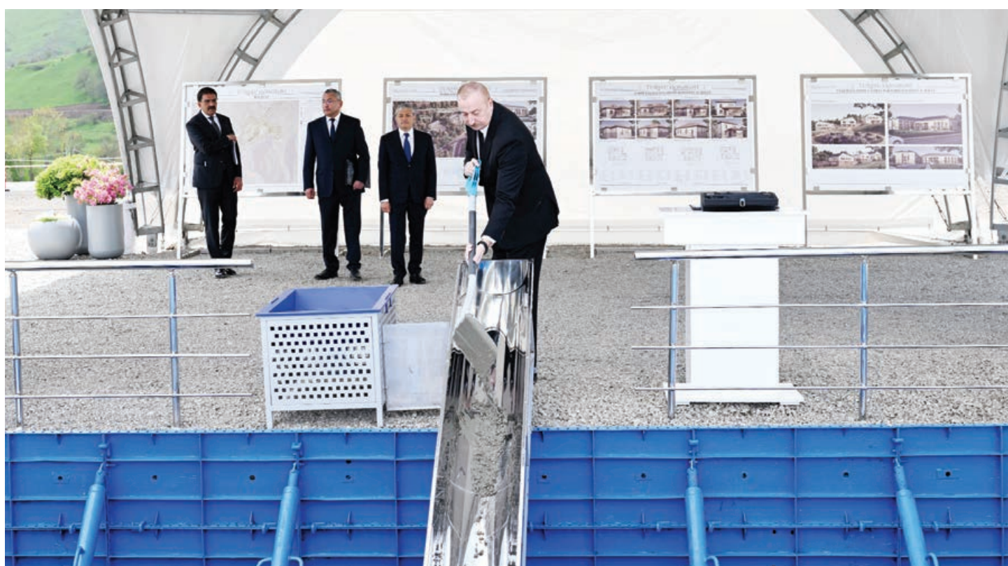
Azərbaycan Respublikasının Prezidenti İlham Əliyev Şuşa rayonunun Turşsu qəsəbəsinin təməlini qoyub.