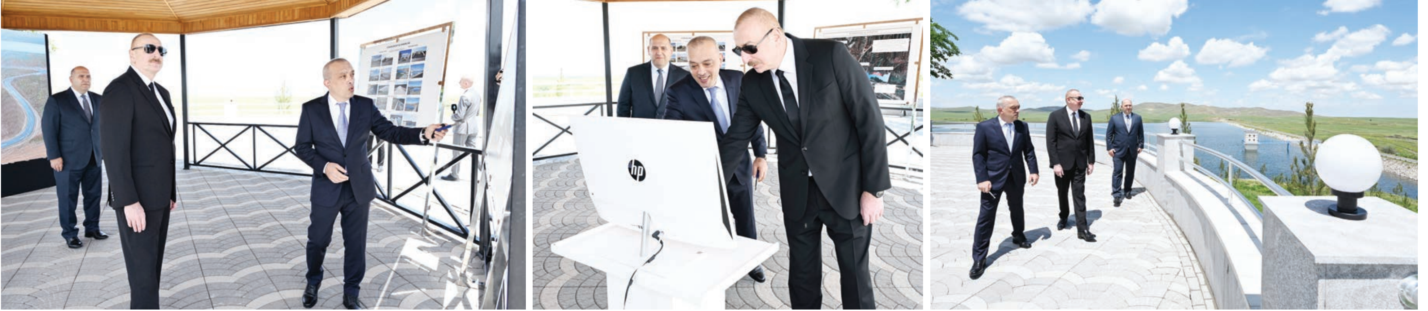
Azərbaycan Respublikasının Prezidenti İlham Əliyev Füzuli rayonunda Köndələnçay su anbarları kompleksinin təmir-bərpadan sonra açılışında iştirak edib.

AZƏRTAC xəbər verir ki, Azərbaycan Dövlət Su Ehtiyatları Agentliyinin sədri Zaur Mikayilov dövlətimizin başçısına görülən işlər barədə məlumat verdi.