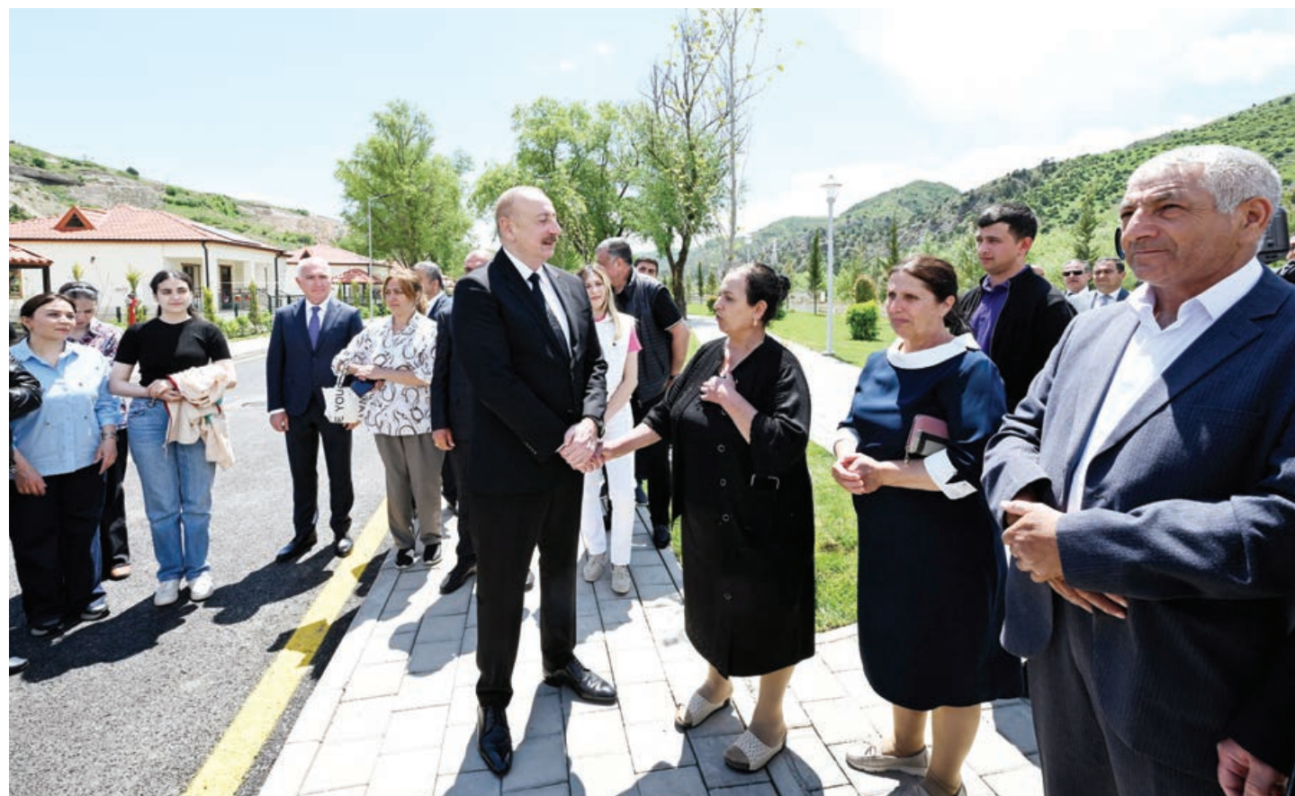
Azərbaycan Respublikasının Prezidenti İlham Əliyev Laçın rayonunun Sus kəndində görüşmüş sakinlərlə tanış olub, kəndə köçmüş sakinlərlə görüşüb.

Laçın rayonunun Sus kəndinə köçmüş sakinlərlə görüş