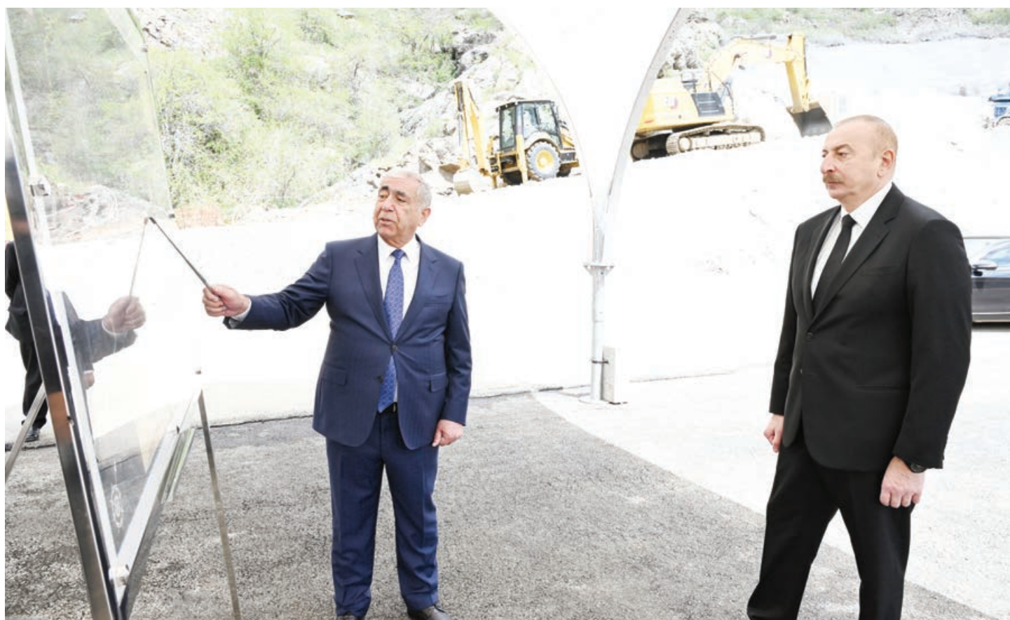
Azərbaycan Respublikasının Prezidenti İlham Əliyev Xankəndi-Şuşa-Laçın avtomobil yolunda görülən işlərlə tanış olub.

Prezident İlham Əliyev Xankəndi-Şuşa-Laçın avtomobil yolunda görülən işlərlə tanış olub